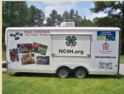
El Mensajero Móvil (M2)

El M2 es un Centro de Información Móvil para las familias del Condado Moore. Está equipado con computadores, Internet e impresoras para que usted pueda crear un Perfil de Community C.A.R.E. y un Plan de Éxito!